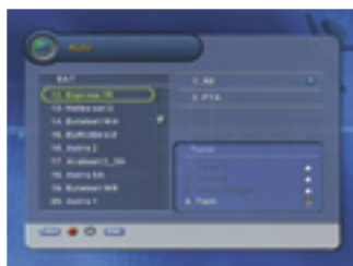
Satellite list |