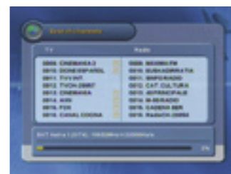
Satellite scan |