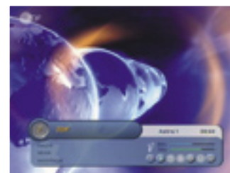
Info Bar |