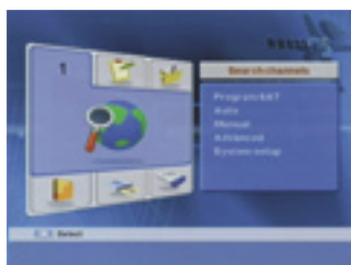
Main menu |